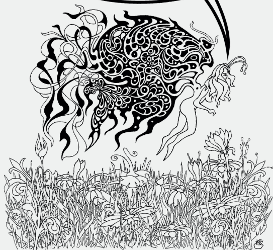
Rys. 4. Okładka Antologii referatów 9. Sympozjum Komiksologicznego (2009) – ilustracja i projekt: Krzysztof Skrzypczyk

zynów (choć po lekturze wpisów na rozmaitych forach internetowych i blogach wydaje się, że bardziej sprzyja podziałom...). W każdym razie wszystkie te elementy i łączące je interakcje tworzą razem specyficzny konglomerat, który można by określić jako kultura komiksu . Celowo użyłem rzeczownika „komiksu”, a nie przymiotnika „komiksowa” – jak nakazywałyby analogie do nazw typu „kultura filmowa”, „kultura literacka” czy „kultura artystyczna” – bowiem na takim określeniu zaciążyłoby dziedzictwo stereotypowo negatywnego postrzegania wszystkiego, co wiąże się z komiksem. Słowo „komiksowy” utożsamiane jest w tym ujęciu z określeniami (nacechowanymi bezwzględnie pejoratywnie) typu: kiczowaty, wtórny, infantylny, uproszczony, przejawskrawiony (przerysowany!), nadmiernie widowiskowy (rozrywkowy) kosztem treści, jakości, wartości 66 . Z kolei słowo „kultura” nie jest tu użyte na wyrost, bowiem od momentu powrotu komiksu do kategorii zjawiska (względnie) masowego